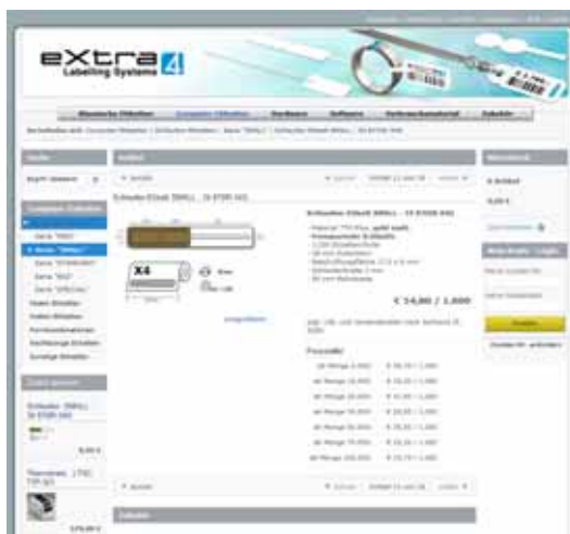
Abb. 02 Etiketten online bestellen im eXtra4-Webshop unter www.shop.extra4.com