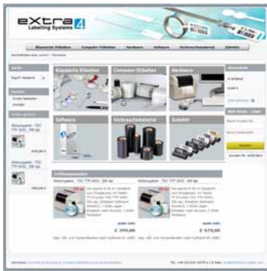
Abb. 01 eXtra4-Webshop mit Eröffnungsangeboten unter www.shop.extra4.com