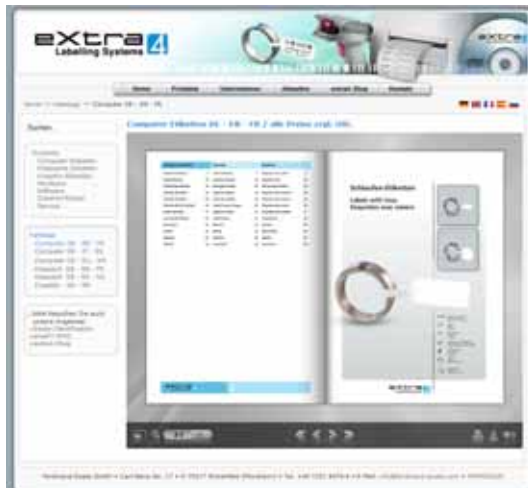
Abb. 04 Etiketten-Katalog zum Blättern unter www.extra4.com